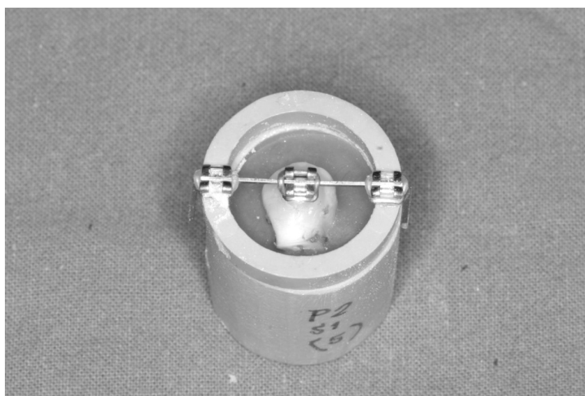
รูปที่ 1 ลักษณะของลวดนำ

Bracket, 3M Unitek, Monrovia, California, USA) ขนาด 12.9 ตารางมิลลิเมตร? เกลี่ยให้มีความหนาสม่ำเสมอ นำมากดลงบนตำแหน่งกึ่งกลางฟันที่เตรียมไว้ โดยทำการซ่อมการกรัดโดยผู้ทดลองคนเดียวกัน และกดแบร็กเกตให้แนบกับผิวฟันมากที่สุด แล้วเชื่อมวัสดุยึดติดโดยรอบออกโดยไม่มีการขยับของแบร็กเกต ฉายแสงด้านใกล้กลาง และไกลกลางของแบร็กเกตที่ติดบนผิวฟันด้านละ 20 วินาที จากนั้นนำกลุ่มตัวอย่างเข้ายึดในท่อน้ำพลาสติกขนาดเส้นผ่านศูนย์กลาง 21 มิลลิเมตร ยาว 40 มิลลิเมตร ด้วยอะคริลิกชนิดบ่มด้วยตัวเอง (Self-cure acrylic) โดยใช้ลวดนำ (Guide wire) (รูปที่ 1) ซึ่งลวดนำจะเป็นตัวกำหนดให้ทิศทางของแรงที่ซัดที่แบร็กเกตมีทิศทางขนานกับพื้นผิวของฟันและพื้นผิวของแบร็กเกต (รูปที่ 2) แช่น้ำกลั่นที่อุณหภูมิ 37 องศาเซลเซียส ทิ้งไว้เป็นเวลา 24 ชั่วโมง ก่อนนำไปทดสอบวัดความแข็งแรงของพันธะเฉือน/ปอก โดยเครื่องทดสอบสากลอินสตรอน (INSTRON, UK) โหลดเซลล์ (Load cell) 1 กิโลนิวตัน ความเร็วในการเคลื่อนที่ของโหลดเซลล์ 1 มิลลิเมตรต่อวินาที 6,12,13 บันทึกค่าความแข็งแรงของพันธะเฉือน/ปอกที่ทำให้แบร็กเกตหลุดออกจากผิวฟัน นำมาคำนวณหาค่าเฉลี่ยความแข็งแรงของพันธะเฉือน/ปอก และส่วนเบี่ยงเบนมาตรฐาน แล้วทำการเปรียบเทียบระหว่างกลุ่มด้วยการใช้ค่าสถิติการวิเคราะห์ค่าความแปรปรวนแบบทางเดียว (ANOVA) และทดสอบการเปรียบเทียบเชิงซ้อน (multiple comparisons) ด้วยการทดสอบเชฟฟี (Scheffe test) ที่ระดับความเชื่อมั่นร้อยละ 95