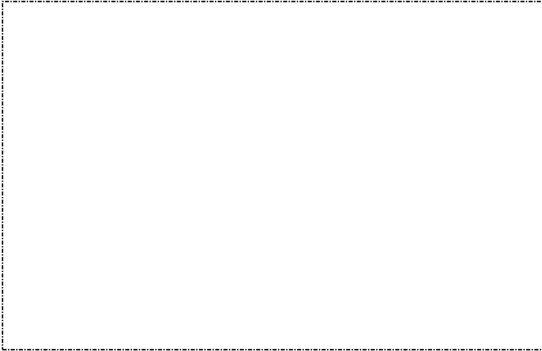
รูปที่ 3 สภาพภายในบ้านผู้สมัคร

รูปถ่ายภาพบ้านที่อยู่อาศัยและทรัพย์สินของครอบครัวผู้สมัคร ให้ผู้สมัครติดรูปภาพตามที่กำหนดดังนี้ (ถ้ามีรูปมากกว่านี้ให้ส่งมาพร้อมใบสมัครได้)