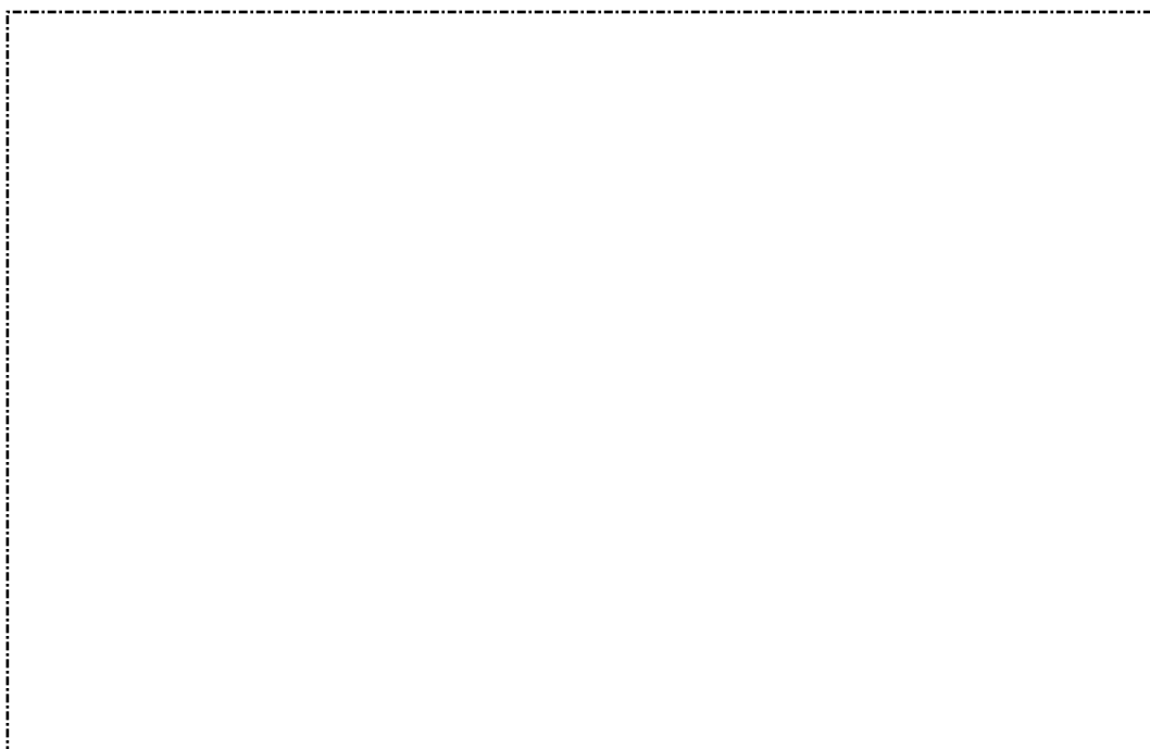
รูปที่ 2 สภาพภายในบ้านผู้สมัคร