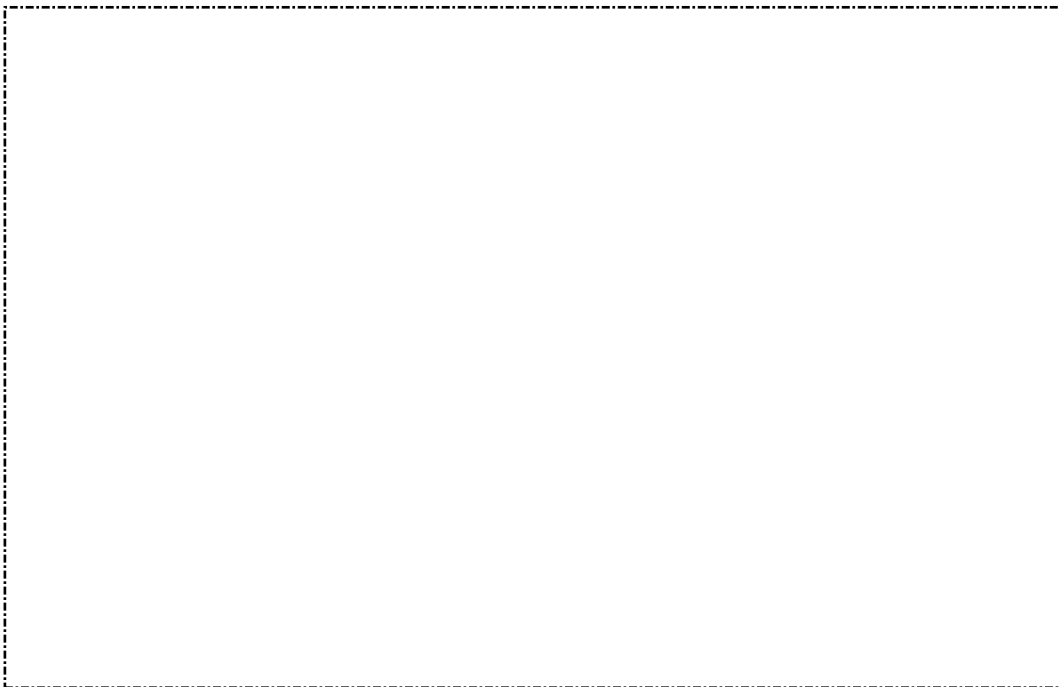
รูปที่ 4 สภาพทรัพย์สินต่าง ๆ