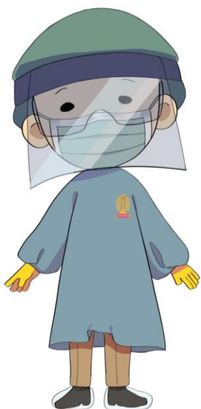
ความเสี่ยงปานกลาง: หัตถการไม่ฟุ้งกระจาย