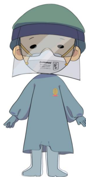
ความเสี่ยงสูง: หัตถการฟุ้งกระจาย

รูปที่ 1: แนวทางการใส่ PPE สำหรับหัตถการที่ไม่ฟุ้งกระจาย และหัตถการที่ฟุ้งกระจาย