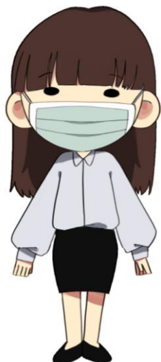
ความเสี่ยงต่ำ: เจ้าหน้าที่ในสำนักงาน